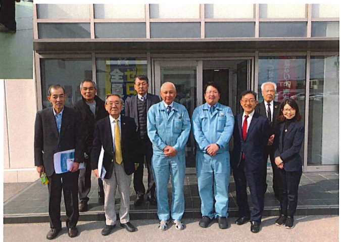
・「教育センター」前にて