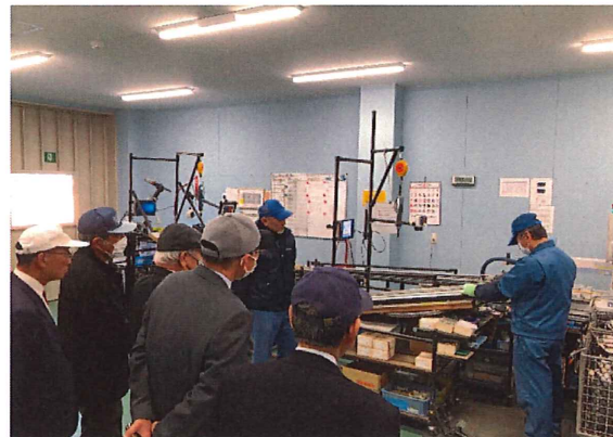
(ネジ締め強度の加工履歴をすべて自動で記録。)