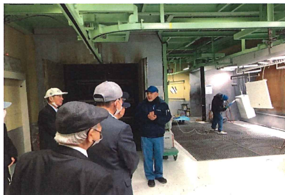
(粉体塗装の着きを良くするための下地処理が大切。)